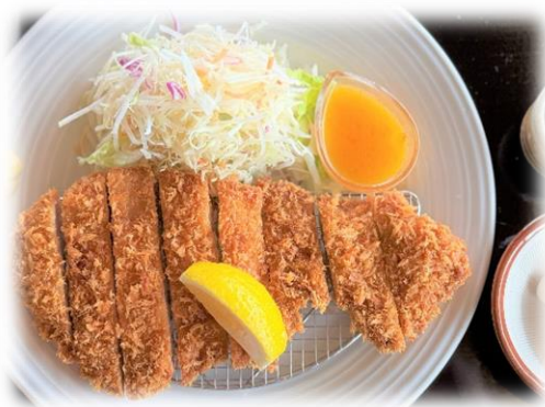
能登島ゴルフの豚カツ